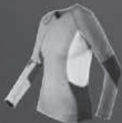
Mammut Alpine Underwear Longsleeve Women