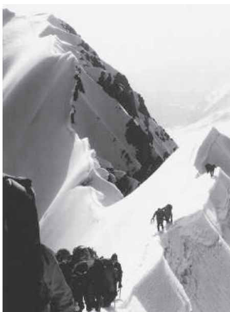
Touren 3. Platz: W. Schmieder