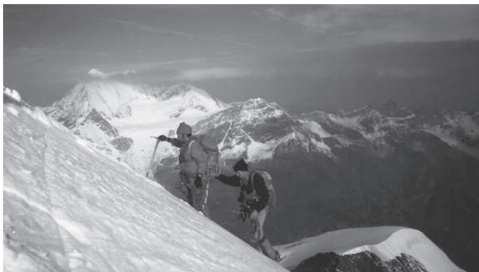
Touren 2. Platz: R. Flückiger